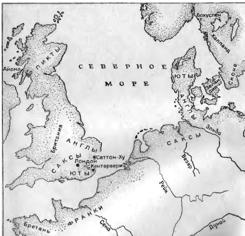
Карта 2. Набеги викингов на Англию. Места распространения скандинавских диалектов.